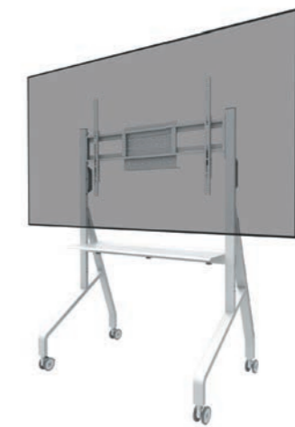
FL50-525WH1 Bildschirmgröße: 55-86" Max. Tragfähigkeit: 76 kg Höhe: 106-136 cm