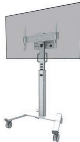
FL50S-825WH1 Bildschirmgröße: 37-75" Max. Tragfähigkeit: 70 kg Höhe: 104-157 cm