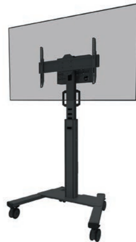
FL50S-825BL1 Bildschirmgröße: 37-75" Max. Tragfähigkeit: 70 kg Höhe: 104-157 cm