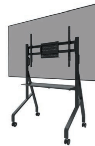
FL50-525BL1 Bildschirmgröße: 55-86" Max. Tragfähigkeit: 76 kg Höhe: 106-136 cm