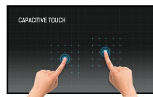
Touch Technologie - Kapazitiv

Die IPS-Displays sind vor allem für weite Betrachtungswinkel und natürliche, hochgenaue Farben bekannt. Sie eignen sich besonders für farbkritische Anwendungen.